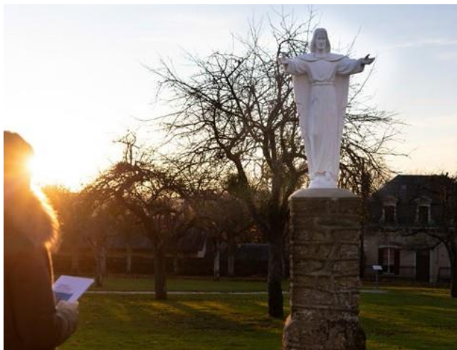
Davanti al Cristo sulla Via Lucis

Una meditazione sulla risurrezione di Cristo presso il Santuario della speranza cristiana