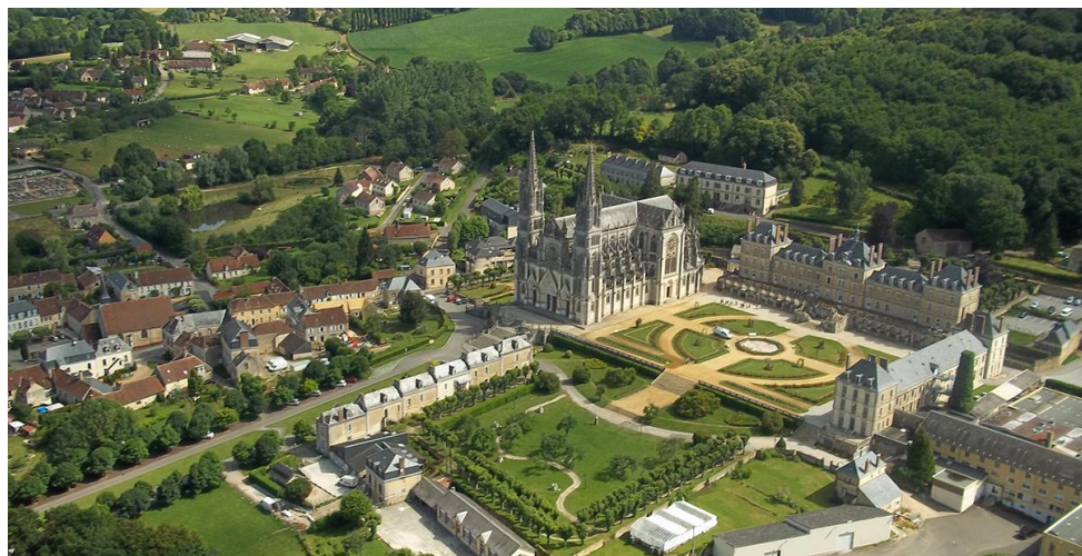
Veduta aerea del Santuario

Accoglienza: 00 33 2 33 85 17 00 reception@montligeon.org www.montligeon.org