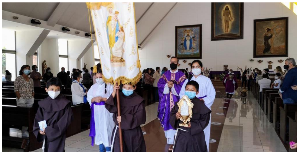
Fraternità di Nostra Signora di Montligeon in Guatemala

1250 gruppi di preghiera in oltre 30 paesi