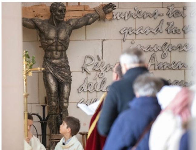
Photo : chemin de croix 2023, © Sanctuaire Notre-Dame de Montligeon

Accueil : 00 33 2 33 85 17 00 sanctuaire@montligeon.org www.montligeon.org