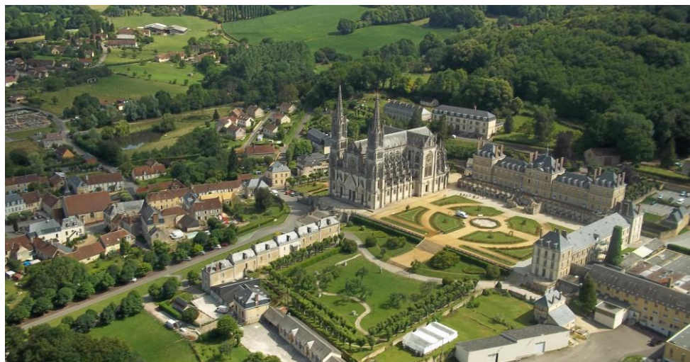
Luftaufnahme des Heiligtums

Empfang: 00 33 2 33 85 17 00 reception@montligeon.org www.montligeon.org