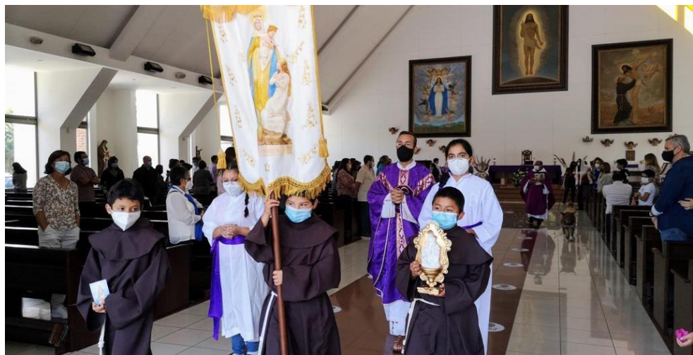
Fraternité Notre-Dame de Montligeon in Guatemala

Die Fraternität Notre-Dame de Montligeon ist eine Vereinigung von Gläubigen, die 1893 von Papst Leo XIII. als Erzbruderschaft gegründet wurde. Ihr Hauptanliegen ist das Gebet für die Seelen im Fegefeuer, insbesondere für die am meisten Vergessenen. Sie ist auf allen fünf Kontinenten vertreten und lädt ihre Mitglieder ein, für die Verstorbenen und alle Personen, die ihr anempfohlen werden, zu beten und beten zu lassen.