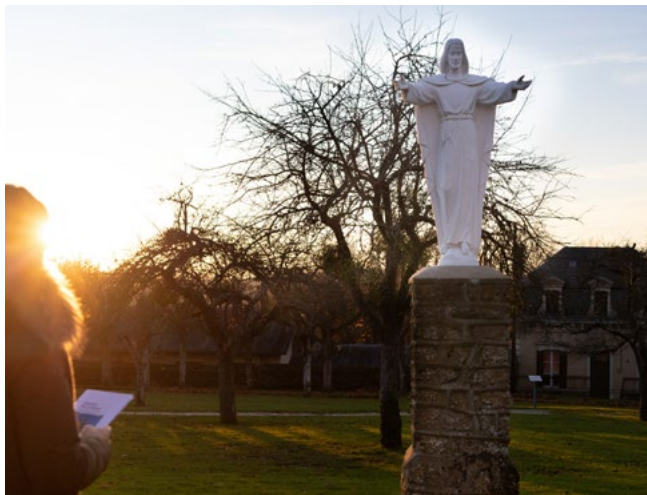
Devant le Christ sur le chemin de lumière

Une méditation sur la résurrection du Christ au sanctuaire de l'espérance chrétienne